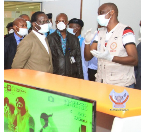
Ilunga Ilunkamba sur le terrain VISITE D'INSPECTION À L'AÉROPORT INTERNATIONAL DE NDJILI

Le Premier Ministre a aussitôt convoqué le Gouverneur de la Banque Centrale du Congo à qui il a remis cette contribution, après l'avoir instruit d'ouvrir un compte bancaire pour recevoir toute autre contribution à venir. AKI