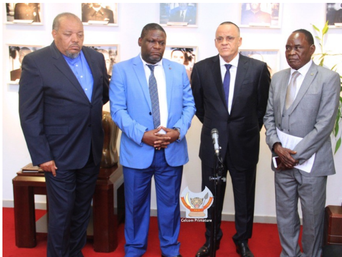
Les représentants de la FEC, ANEP, COPEMECO et FENAPEC à la Primature