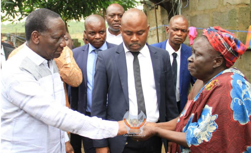
Ilunga Ilunkamba sur le terrain À L'ÉCOUTE DU PEUPLE DU CONGO PROFOND